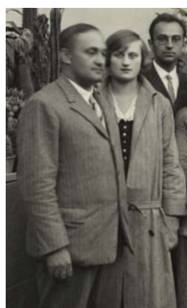
Výstavní expozice A. Čákory (obě fotografie byly pořízeny na výstavě Spolku 1928)