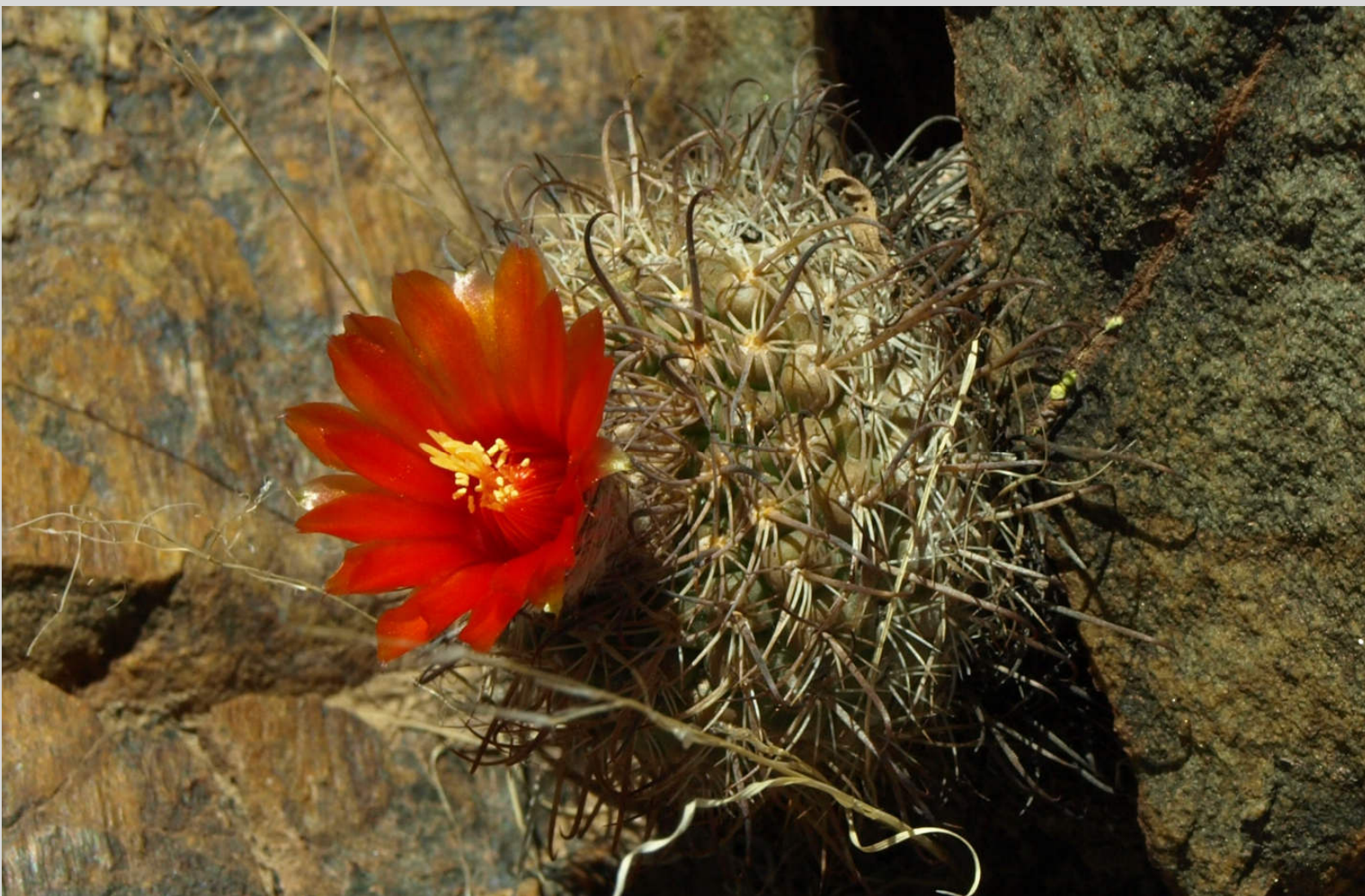
Parodia faustiana TB 8.2

Pro letošní přednášku si pro nás připravil průřez miniaturními taxony rodu Parodia , které rostou převážně v Argentině. Uvidíme jednotlivé rostliny, včetně jejich lokalit a dozvíme se plno dalších zajímavostí z cesty, kterou neobvykle podnikl s celou rodinou.